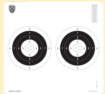
Scheibe für 25m Präzision Büchse

Schusszahl: 2 x 10 Schuss in 2 x 5 Minuten (jeweils 5 Schuss auf jeden Spiegel)