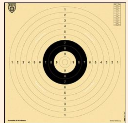
Scheibe für Präzision

Wertung: Die 20 Schuss Präzision können getrennt von den 40 Schuss Kombi gewertet werden, so dass auch nur Präzision geschossen werden kann.